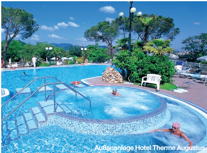
Außenanlage Hotel Terme Augustus