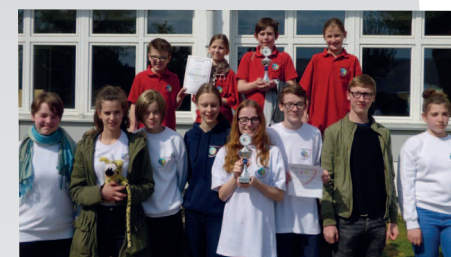
Siegergruppen Meckesheim und Dossenheim des diesjährigen JRK-Wettbewerbs in Sandhausen

In Kooperation mit dem Stadtjugendring (SJR) Heidelberg lernen angehende Erstklässler in einem dreiwöchigen Schulanfängercamp die verschiedenen Hilfsdienste in Heidelberg kennen: Wie sieht ein Rettungswagen von innen aus? Was machen Hunde bei der Polizei? Und wie lang ist die Drehleiter der Feuerwehr? Dazu kommt viel Spiel und Spaß rund um die Tiefburg, das Programm „Kinder stark machen“ und eine kindgerechte Ersthelferausbildung. Die Schulanfängercamps sind eine Heidelberger Besonderheit und schließen eine Betreuungslücke zwischen dem Ende der Kindergartenzeit und dem Anfang des Schulbesuchs.