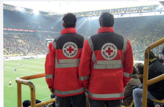
Ehrenamtliche Sanitäter sind schneller einsatzbereit wo es akut zu einer Notlage kommt