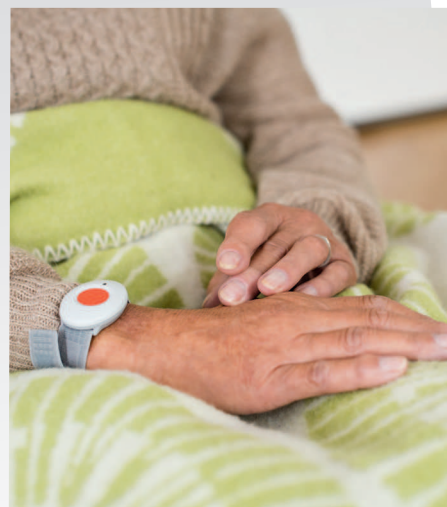
Die Hilfe ist nur einen Knopfdruck entfernt: Wer alleine lebt, fühlt sich so sicherer.

Ein Hausnotruf ist zwingend notwendig, wenn ältere Menschen alleine leben, manchmal unsicher auf den